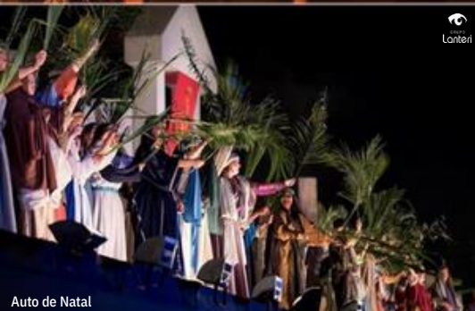
Auto de Natal