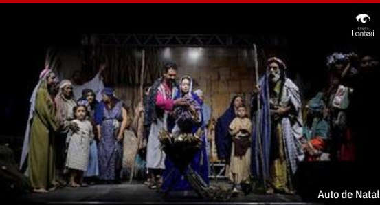
Auto de Natal