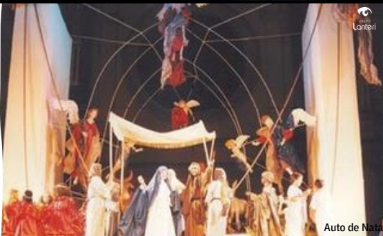
Auto de Natal