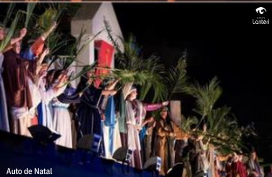
Auto de Natal