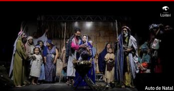
Auto de Natal