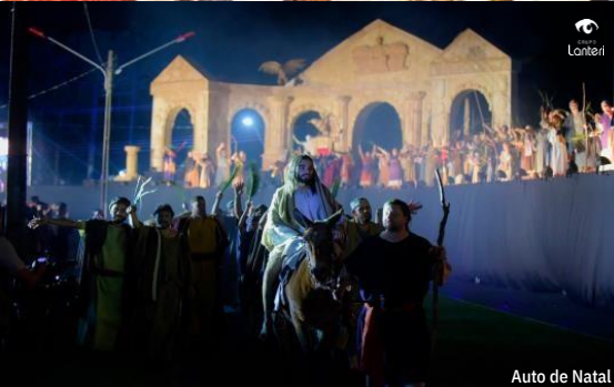
Auto de Natal