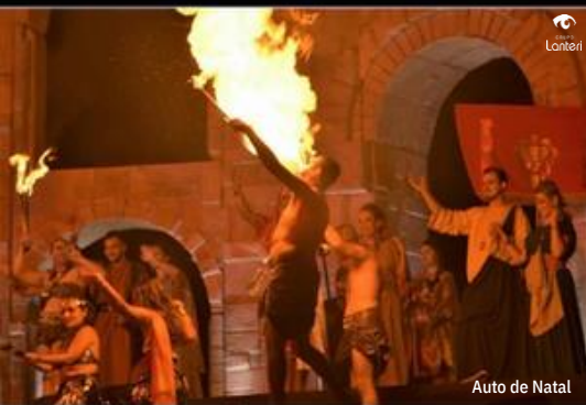
Auto de Natal