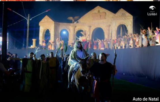
Auto de Natal