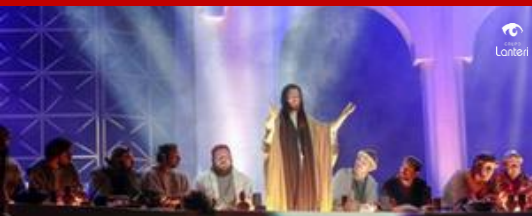
Auto de Natal